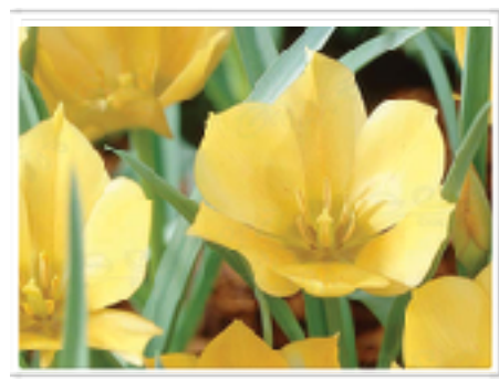
Bokharatulpan "Bright Gem"