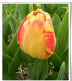
Banja Luka