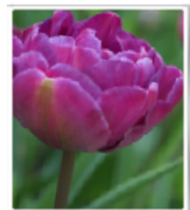
Blue Diamond