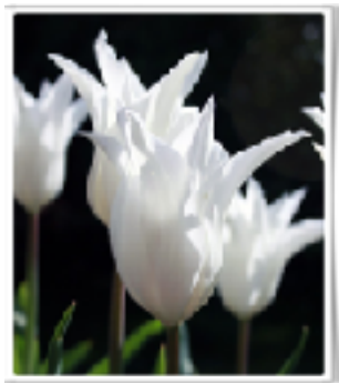
White Triumphator